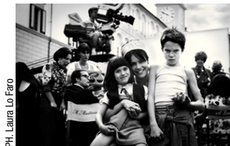
PH. Laura Lo Faro